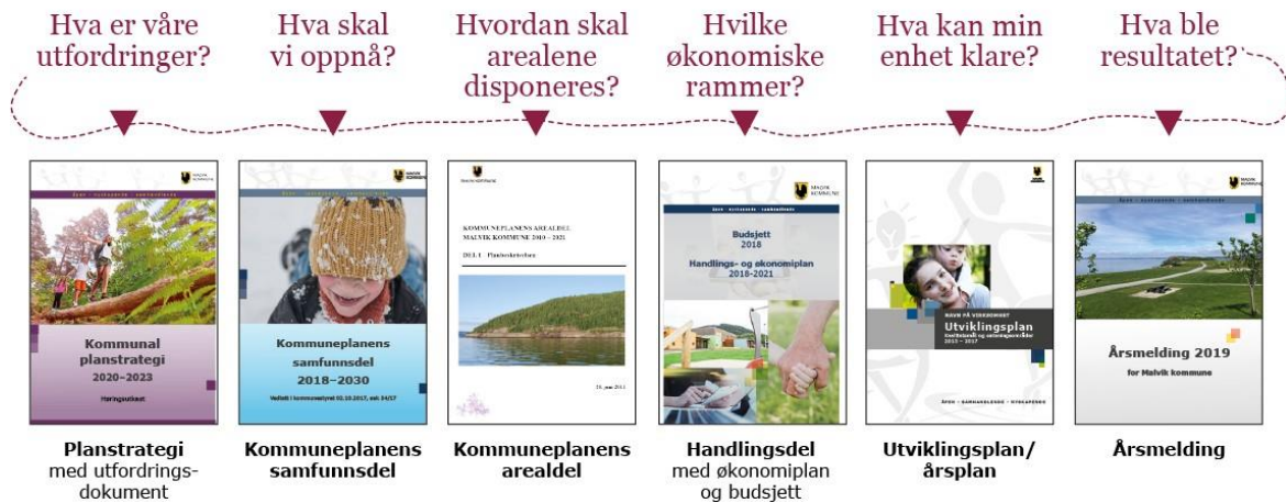
Figur 4: Plan- og styringssystemet i Malvik, "Den røde tråden."

Kommuneplanen er kommunens øverste styringsdokument, og består av to deler: En samfunnsdel og en arealdel.