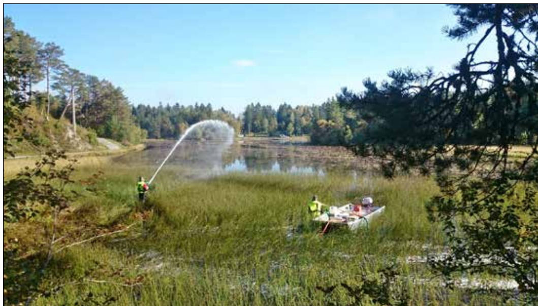
Breddespyling av rotenon.

Rotenon utvinnes av derrisrot som er røtter av tropiske og subtropiske planter i gruppene Derris og Lonchocarpus innen erkeblomstfamilien (Leguminosae) (USEPA 2007). Rotenon virker ved å blokkere elektrontransportsystemet i mitokondriene og hemmer derved respirasjonen på cellednivå. I Norge brukes rotenonløsningen CFT-Legumin, der 3,3 % av det ellers svært lite vannløselige virkestoffet er blandet med ulike løsnings- og dispergeringsmidler. Normal doseringskonsentrasjon ved bekjempelse av gjedde er ca. 33 µg rotenon pr. liter, tilsvarende én milliondel (ppm) av rotenonløsningen CFT-Legumin. Både rotenon og hjelpestoffene i løsningen brytes etter hvert ned til ufarlige stoffer, avhengig av temperatur og lystilgang (Finlayson mfl. 2010). Tiden det tar før rotenon forsvinner varierer fra noen få dager i grunne dammer til flere måneder i dype kalde innsjøer. Rotenon er svært giftig for fisk og har ellers varierende giftighet for andre akvatiske organismer. Fisk tar meget lett opp rotenon over gjellene, og gjedde er blant de fiskeartene som har lavest rotenontoleranse. De akutte virkningene på bunndyr kan også være betydelige, men både diversitet og biomasse reetableres i løpet av relativt kort tid (Arnekleiv mfl. 2015). Responsen blant akvatiske invertebrater overfor rotenon varierer, og den avhenger også i stor grad av eksponeringstiden (Fjellheim 2004, Eriksen mfl. 2009, Kjærstad mfl. 2018).