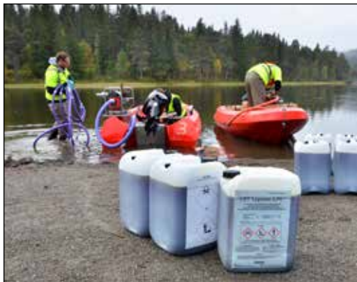
Opplasting av rotenon i båt.