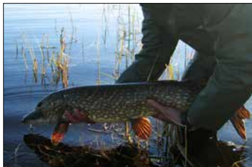
Gjedda er en effektiv rovfisk som ofte oppnår ei vekt på over 10 kg.

Høsten 2013 ble Skjeltjørna og fire andre vatn (Ertstjørna, Vulusjøen, Mørkdalstjørna og